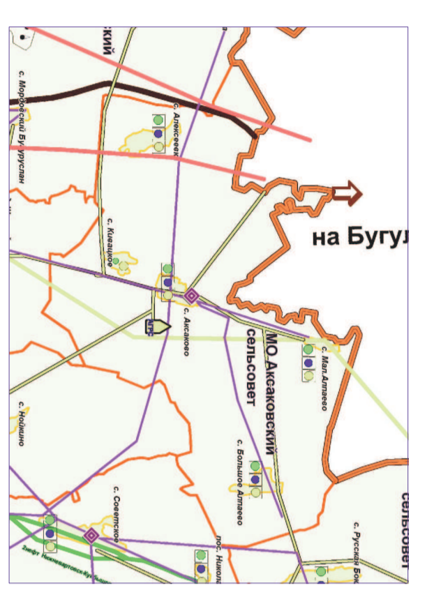
Фрагмент размещения объектов электро и газоснабжения Схемы территориального планирования МО Бугурусланский район.